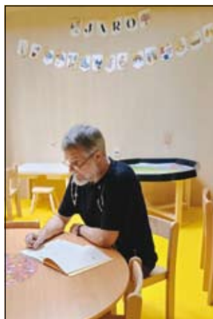
z čtení dětem