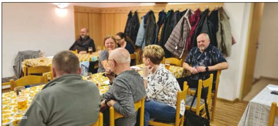
účastníci Beer pongu