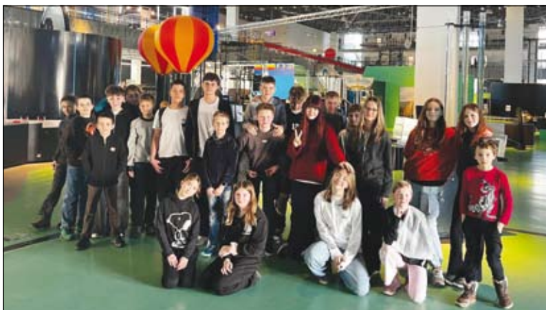
členové Klubu nadaných dětí z naší školy v Brně

Členové Klubu nadaných dětí z naší školy se vydali na zajímavý výjezd do Brna, kde navštívili oblíbené interaktivní VIDA! science centrum. Cílem exkurze bylo přiblížit dětem vědu zábavnou a praktickou formou a podpořit jejich zvědavost.