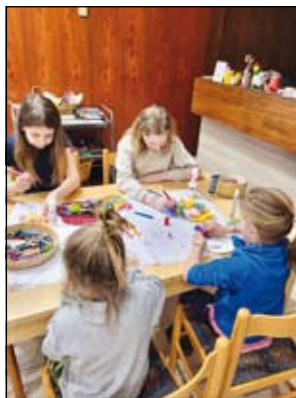
dělničky pro děti

Tradiční velikonoční jarmark přilákal 14. března do Obecního domu v Ludgeřovicích rekordní množství návštěvníků z obce i širokého okolí, kteří si přišli užít atmosféru blížících se svátků jara. Letošní ročník nabídl pestrou přehlídku lidových řemesel, prodejní stánky s velikonoční tematikou a bohaté občerstvení. Návštěvníci mohli obdivovat a nakupovat ručně vyráběné kraslice, pomlázky, jarní dekorace na stoly i dveře, keramiku a další výrobky, které dýchaly tvůrčí šikovností místních i přespolních řemeslníků. Letos poprvé mohli návštěvníci v tombole vyhrát půlku prasete.