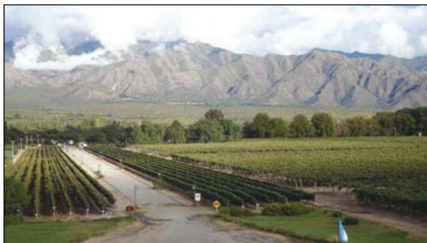
vinařství v Argentině