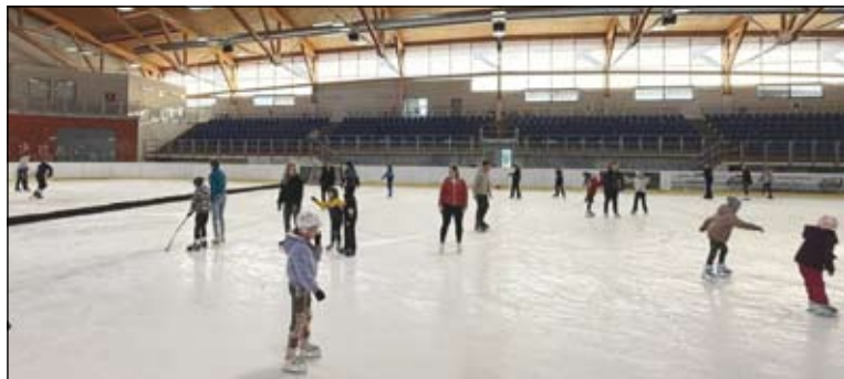
žáci ZŠ Ludgeřovice a jejich rodiče

PS: Pátek třináctého je jen pověra, vše proběhlo skvěle.