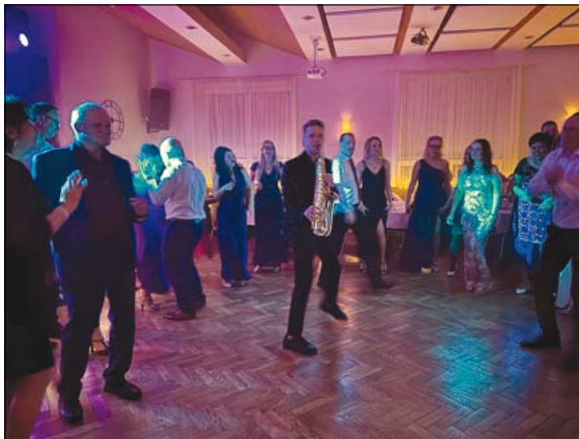
z Jarního bálu ANO