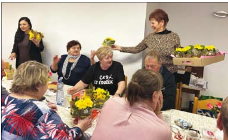
z oslavy MDŽ v klubu