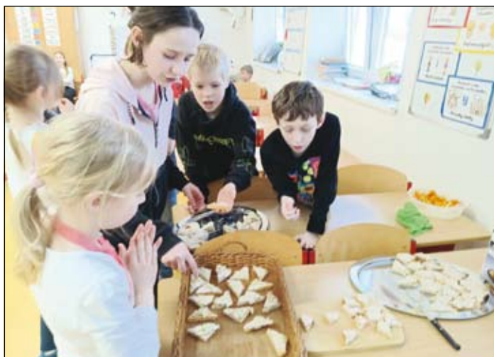
žáci školní družin u přípravy své pomazánky