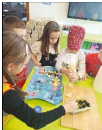
žáci školní družiny při čtení svého receptu a výrobě pomazánky