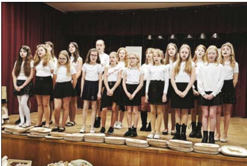
žákyně 3. až 7. ročníku (členky školního pěveckého sboru)

Dívkám se vystoupení velmi povedlo a velký potlesk všech zúčastněných byl tou největší odměnou za úsilí, které naše žákyně vložily jak do pečlivé přípravy, tak do samotného vystoupení. Je nám ctí, že se můžeme pochlubit tím, jak talentované žáky naše škola má.