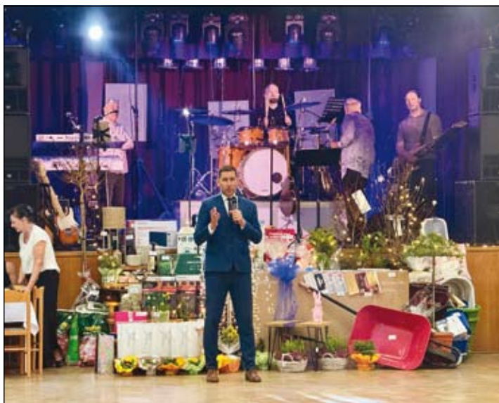
z Jarního bálu ANO

Jarní bál ANO Ludgeřovice byl skvěle zorganizovanou akcí, která opět potvrdila, že podobná setkání mají v obci své pevné místo. Velké poděkování patří všem sponzorům, organizátorům i návštěvníkům, kteří svou účastí přispěli k nezapomenutelné atmosféře tohoto krásného večera.