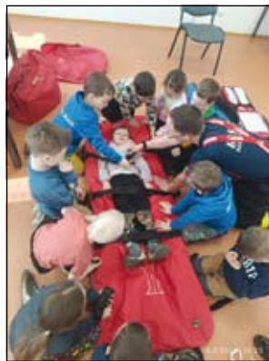
z návštěvy u hasičů