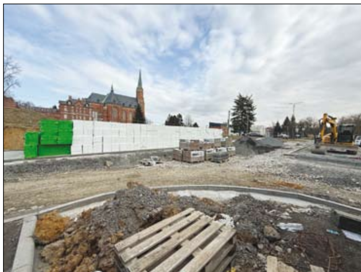
foto ze stavby centra služeb z 12. března