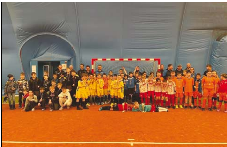
bráči a trenéři jednotlivých zúčastněných týmů

V neděli 1. března proběhl v naší nafukovací hale další z turnajů, které pro fotbalisty a fotbalistky Ludgeřovic připravujeme již několik let. Turnaj byl tentokrát určen pro kategorii U11 a celkovým vítězem se stalo družstvo Koberčic. Pro nás jsou však vítězi kluci a holky všech zúčastněných týmů. Pohled na plnou halu sportujících dětí a fandících rodičů musí hřát u srdce nejen všechny na místě, ale všechny, kteří mají k pohybu a sportu blízko. Jsme rádi, že jsme mohli halu naplnit i v neděli, kdy bohužel většinou zeje prázdnotou, a věříme, že turnaj posloužil nejen k změření sil, ale také k tomu, aby se mohli trenéři mezi sebou domluvit na další případné spolupráci při organizování přátelských zápasů a turnajů. Trenérům děkujeme za jejich obětavou práci, rodičům za podporování svých ratolesti a malým sportovcům za to, jak celý turnaj naplno odmakali.