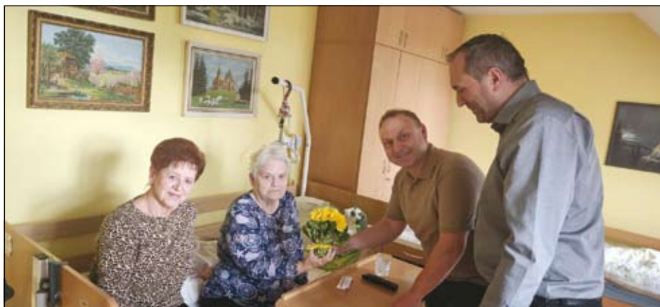
z návštěvy v Charitním domově sv. Mikuláše

Děkujeme Charitě Hlučín i pracovníkům Domova za jejich každodenní péči a všem seniorkám přejeme pevné zdraví, klid a mnoho dalších radostných dní.