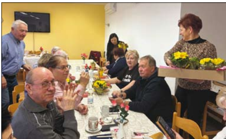
z oslavy MDŽ v klubu