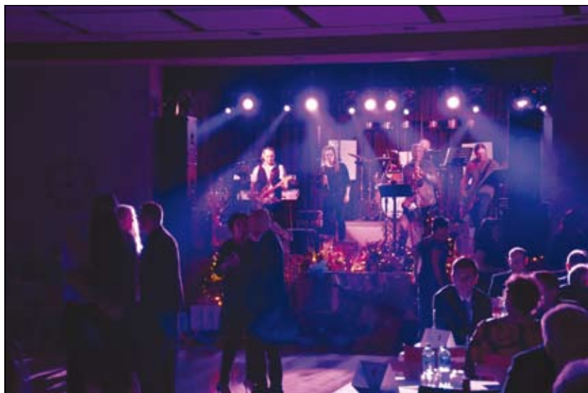
z Jarního bálu ANO