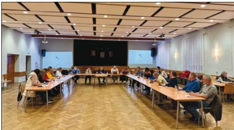
z 18. zasedání Zastupitelstva obce Ludgeřovice

Prítomno bylo 19 zastupitelů a 11 občanů.