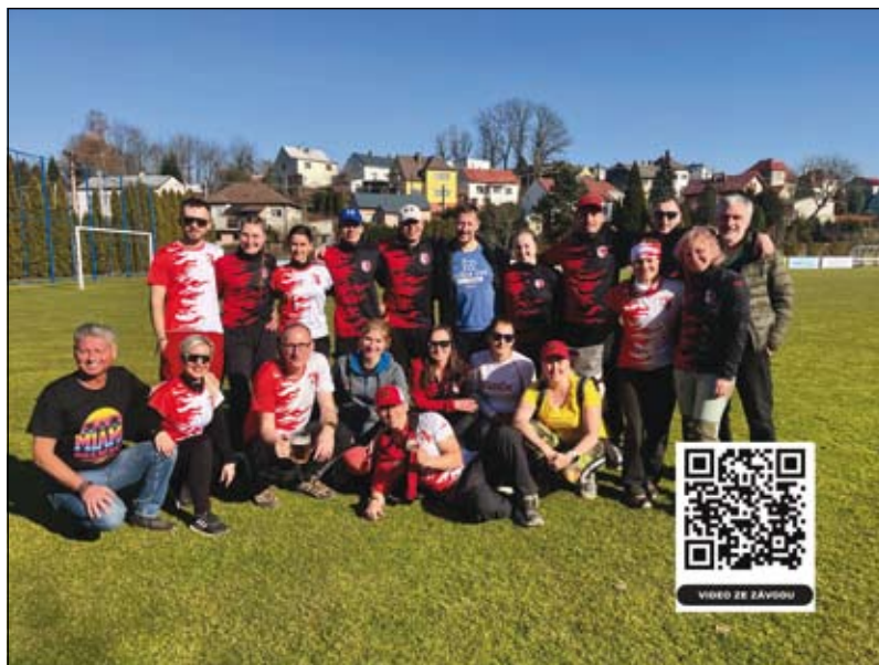
tým BK Ludčeřovice