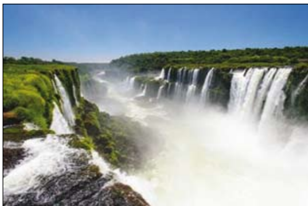
vodopády v Argentině

Na svých cestách po tomto státě navštívil několik vinařství a vinogradů. Také se zajímal o pěstosí farmy. Uchvátily ho nádherné vodopády na hranicích Argentiny a Brazílie, které jsou z největších přírodních divů světa. Kromě krás této země, ale