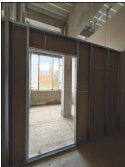
foto ze stavby centra služeb z 12. března

Budu stavbu dále sledovat a zase někdy udělám fotoprohliďku. S vedením společnosti jsme v kontaktu a oběma stranám, jak vedení obce, tak vedení Hrušky a Flosmana jde o to, aby se stavba povedla otevřít včas (stále trvá termín konec září 2026) – společnost je naštěstí otevřena ke komunikaci a jednání ze strany obce, a ta jednání pravidelně probíhají, což je pro občany i pro obec skvělá zpráva. Držíme tedy palce, aby se vše vyvíjelo tím správným směrem!