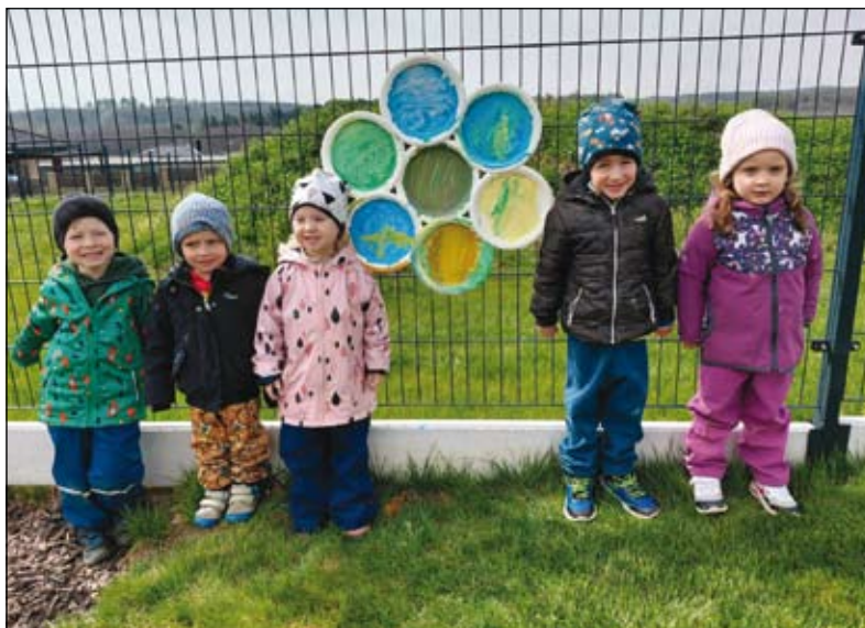
děti z MŠ Kulíšci