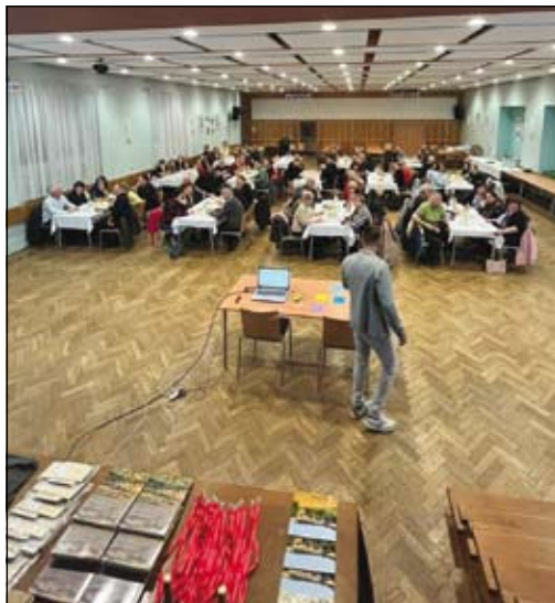
z 3. ročníku kvízu pro spolky a organizace

Do kvízu se tentokrát zapojilo 12 týmů, mezi kterými nechyběli: Důchodci Ludgeřovice, Důchodci Vrablovec, Sousedé 55+, TJ Ludgeřovice, Hasiči Ludgeřovice, Hasiči Vrablovec, Ludger carp team, Zahrádkáři, Běžecký klub, Kulturní komise, Pošli to dál! a Učitelé ZŠ.