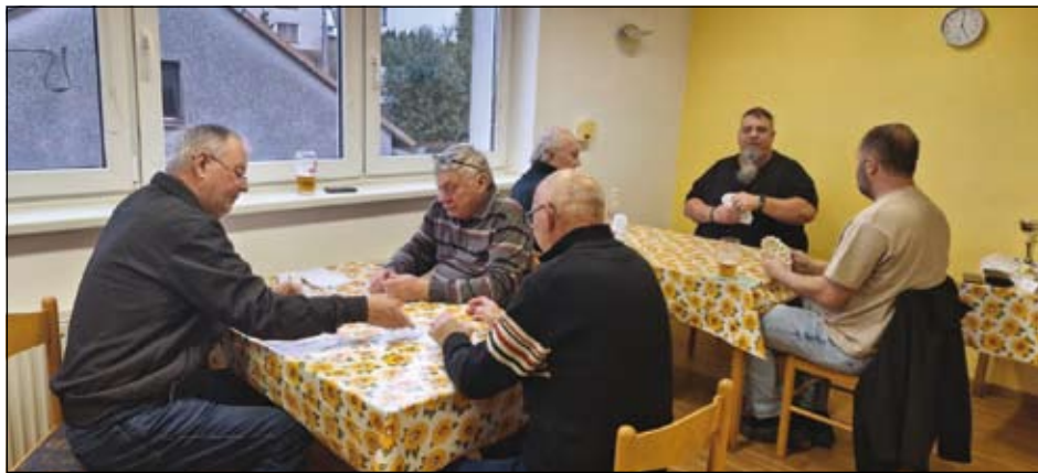
z turnaje v kartách