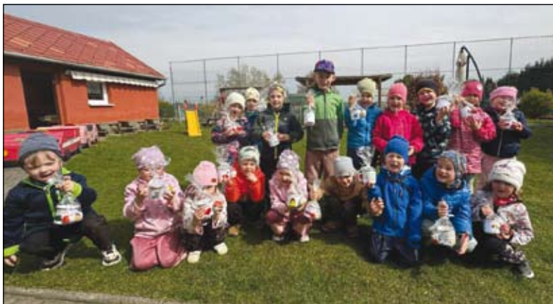
hledání velikonočního zajíčka