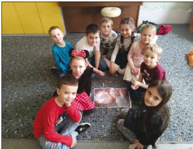
Žákyně školní družiny z dolní školy hledají klíč k tajence.

Misi jsme splnili! Díky odvaze dětí jsou všechny příběhy zpět mezi řádky tam, kam patří.