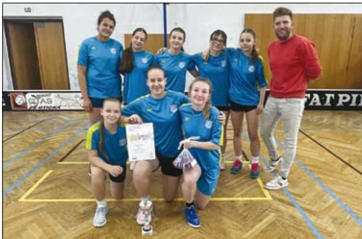
z Mc Donalds Cupu- kategorie A

Ve čtvrtek 16. dubna se v Opavě uskutečnilo okresní finále v basketbalu dívek, ve kterém se nám podařilo porazit ZŠ Englišova i ZŠ Kylešovice, nestačili jsme naopak na ZŠ Vrchní