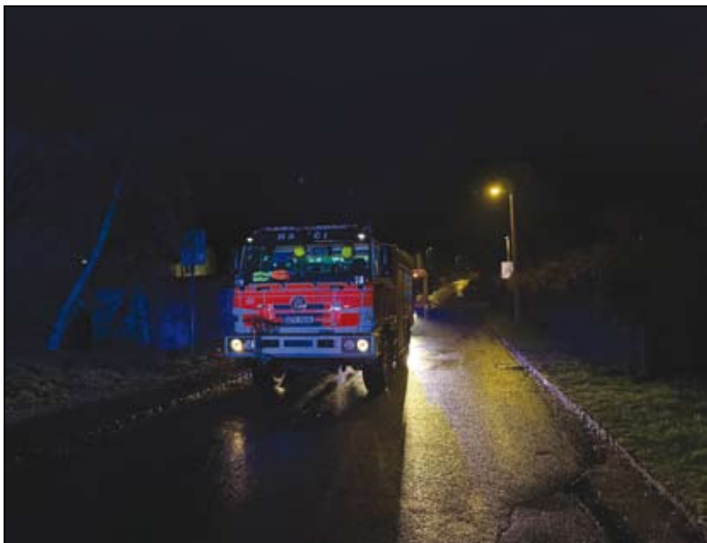
foto z nočního zásahu

Nezbývá než opět vydvihnout naše rodiny a zázemí za jejich trpělivost s námi.