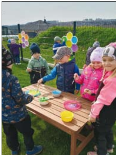
děti z MŠ Kulíšci