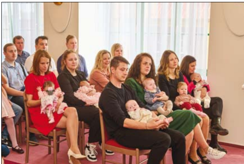
z vítání občánků