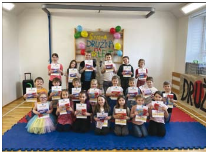
účinkující žáci z dolní školy se svými diplomy

Závěrem března se v naší školní družině uskutečnil již 5. ročník oblíbené show Družina má talent. Děti předvedly pestrá a originální vystoupení. Ukázaly velkou dávku odvahy i nadšení. Celou akci provázela skvělá atmosféra plná podpory a potlesku. Děkujeme všem účinkujícím za jejich úsilí a krásné výkony. Už teď se těšíme na další ročník!