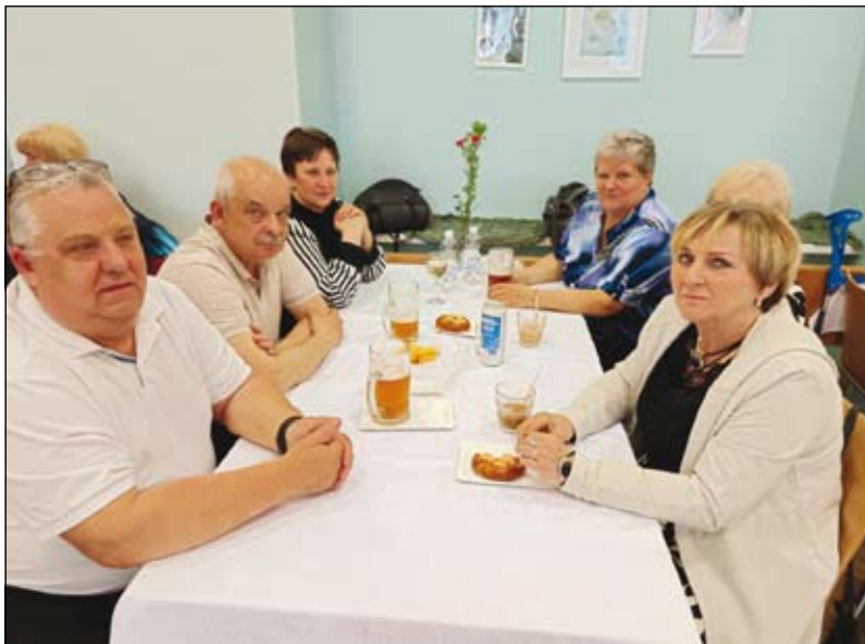
z vítání jara