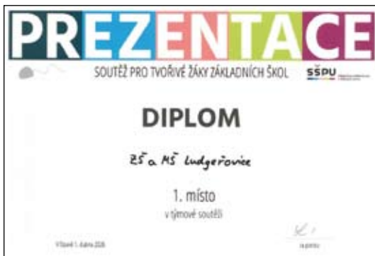
ze soutěže Prezentace