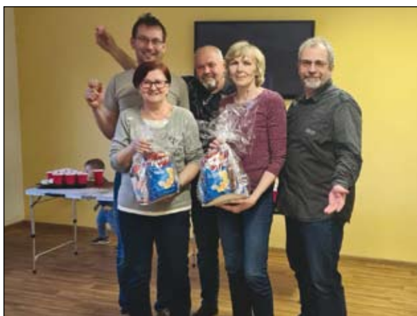
z berního odpoledne