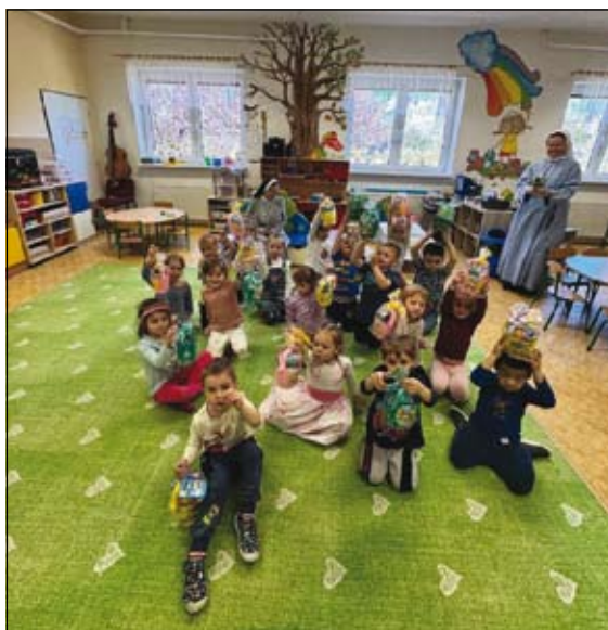
velikonoční hledání zajíčka

Velikonoční čas jsme zakončili milou tradicí – děti se vydaly hledat velikonočního zajíčka a za svou snahu byly odměněny dárečkem pro radost. Celé období jsme si užili v přátelské atmosféře, na kterou budeme dlouho vzpomínat.