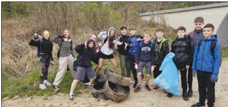
žáci při úklidu obce během Dne Země

jaro je neodmyslitelně spojeno s rozpuškem zeleně, květy, mláďaty, prostě matka příroda předvádí svou sílu a vitalitu. Stejně tak se stal již samozřejmostí úklid obce i jejího okolí v rámci akce Den Země. Také letos se zapojil do úklidu celý druhý stupeň naší základní školy, ludgeřovičtí hasiči, Technické služby Ludgeřovice a v květnu se ještě přidají členové Běžeckého klubu Ludgeřovice. V pátek 17. dubna dopoledne vyrazili učitelé a žáci 6.–8. tříd podle určených tras do terénu, vybaveni rukavicemi, pytlí a dobrou náladou. Byť počasí zpočátku výpravám příliš nepřálo a chvílemi i přšelo, všichni své trasy poctivě prošli a uklidili vesnici, okolní polní cesty i části lesů. Těžší a rozměrnější odpad ponechali na předem domluveném místě, tříděné plasty pak donesli až k obecnímu úřadu. Zaměstnanci technických služeb všechny nalezené odpady sesbírali a předali k další likvidaci. V sobotu naši hasiči prošli a uklidili celý tok Ludgeřovického potoka od Petřkovic až po Markvarto-