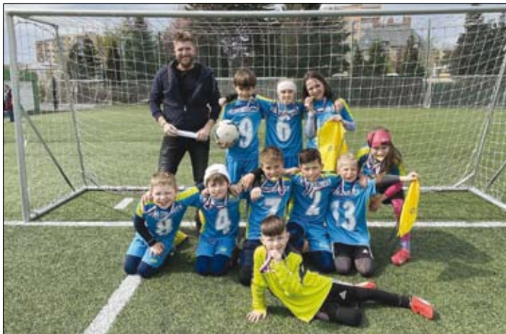
z Mc Donalds Cupu- kategorie A

Postupně dokázali rozstřílet ZŠ Hradec nad Moravicí – Církevní 15:1, ZŠ Háje ve Slezsku 12:0 a ZŠ E. Beneše Opava 13:0. Díky vítězství ve skupině postupují do okresního finále!