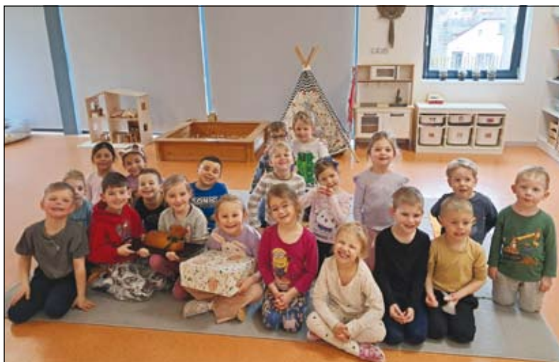
děti z MŠ Sovičky