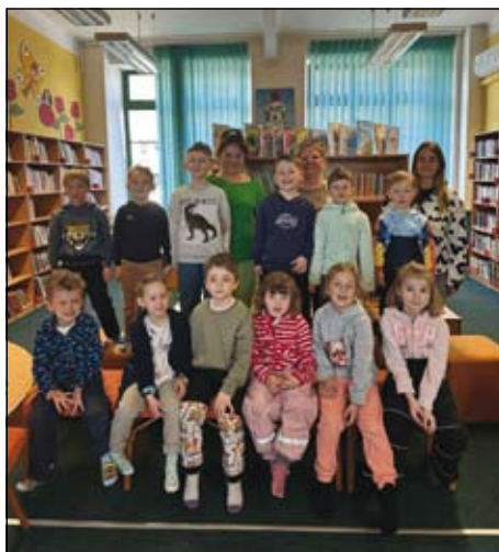
z návštěvy knihovny

Jaro jsme přivítali také velikonočním hledáním zajíčka. Děti s nadšením plnily připravené úkoly a podle stop hledaly ukrytá překvapení na školní zahradě. Radost