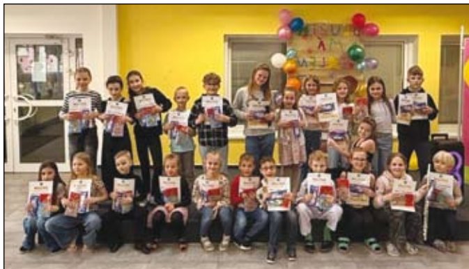
účinkující žáci z horní budovy se svými diplomy