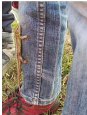
překvapení v trávě

Dozvěděli jsme se také spoustu zajímavých střípků. Překvapilo nás například, jak málo bez vody vydržíme, jak vznikají mraky nebo kolik vody vlastně denně spotřebujeme.