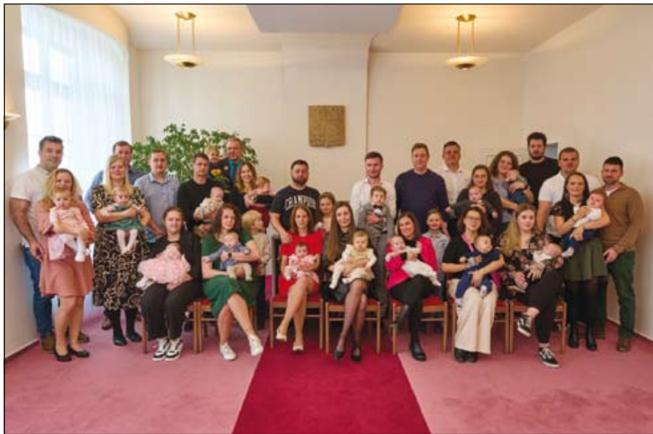
z vítání občánků