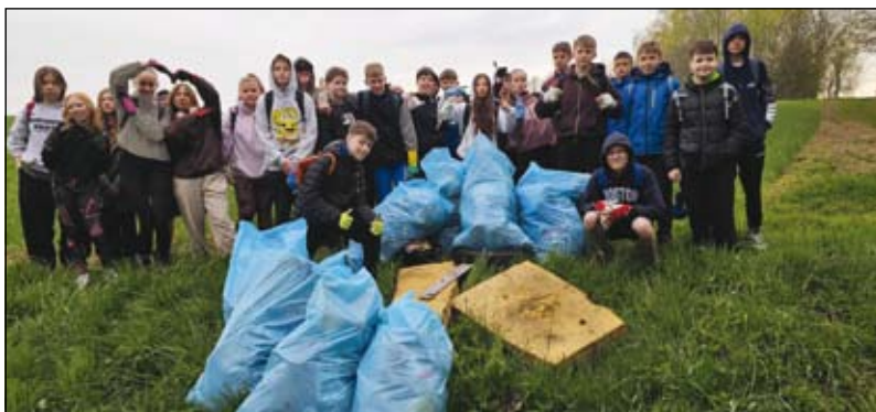
žáci při úklidu obce během Dne Země