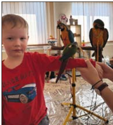
z návštěvy papoušků v MŠ

Každodenní život ve školce je však tvořen i drobnými okamžiky – společným hraním, tvořením, zpíváním, pohybovými aktivitami i pobytem venku. Snažíme se dětem vytvářet prostředí plné pohody, bezpečí a radosti, kde mohou rozvíjet své dovednosti, fantazii i kamarádké vztahy.