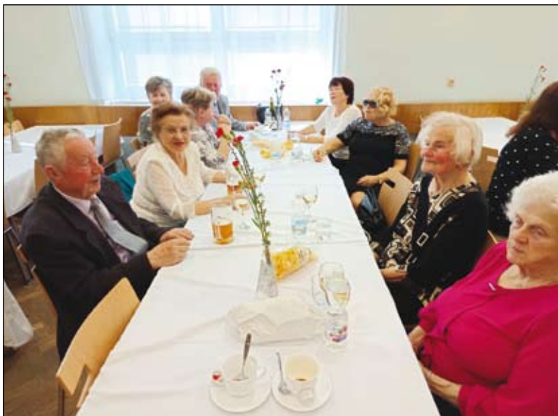
z vítání jara