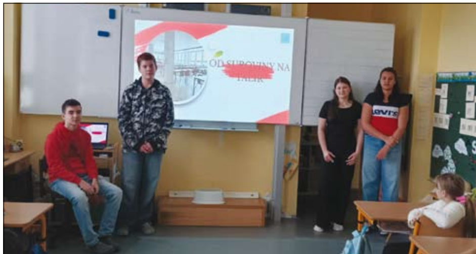
žáci 9. tříd při prezentaci

Děkujeme našim devátákům za skvělou iniciativu a týmu školní jídelny za spolupráci. Dobrou chuť a nezapomeňte: úsměv nic nestojí, ale v kuchyni udělá velkou radost!