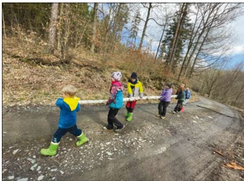
Těžko na cvičišti, lebko na bojišti.

Výprava byla zároveň přípravou na Závod světlušek a vlčat, který letos pořádali skauti z Mariánských hor a konal se 11. dubna v Ostravě – Nové Vsi. Holky i kluci se potkali se spoustou skautských kamarádů a skvěle si zasoutěžili a zažili skvělou atmosféru. Tým Modrých vlků získal první místo a postupuje do krajského kola! Nutno zmínit osobní zápas jednoho vlčete, kterému se strašně nechtělo jet, ale protože skauti drží slovo, porazil sám sebe, splnil svůj slib, přišel a byl důležitým členem vítězného týmu. Přejeme Vám hodně sil k dodržení slova i do všech zápasů s tím špatným v nás.