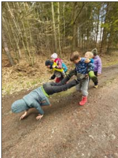
náročné sportovní úkoly