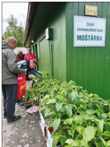
z loňské burzy pěstebních přebytků

V průběhu srpna Vás zveme na Letní slavnost na moštárně, konkrétní termín bude včas zveřejněn.