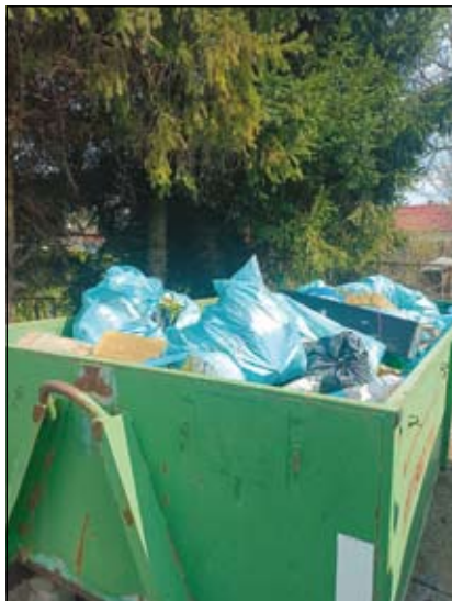
část posbíraného odpadu