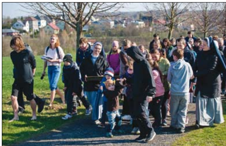
křížová cesta na Ostříž

Velikonoční čas jsme zakončili milou tradicí – děti se vydaly hledat velikonočního zajíčka a za svou snahu byly odměněny dárečkem pro radost. Celé období jsme si užili v přátelské atmosféře, na kterou budeme dlouho vzpomínat.