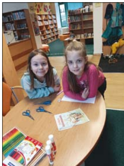
ze zábavného odpoledne v knihovně