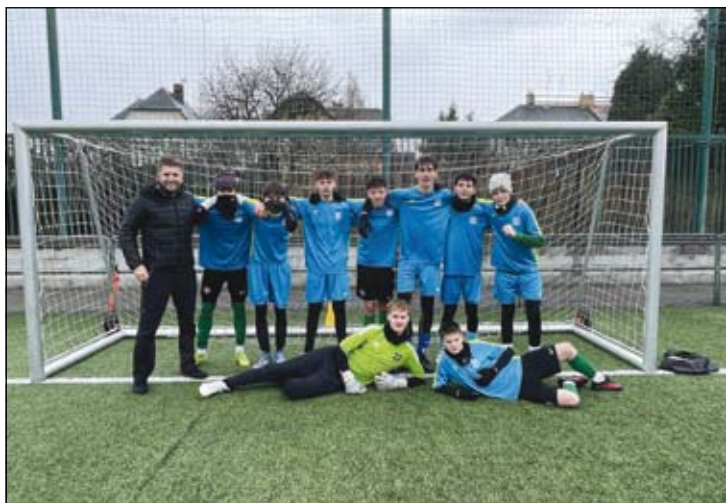
z minifotbalu chlapců vyšší stupeň