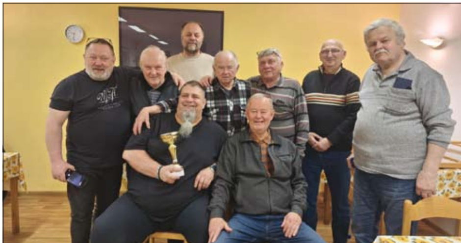
z turnaje v kartách