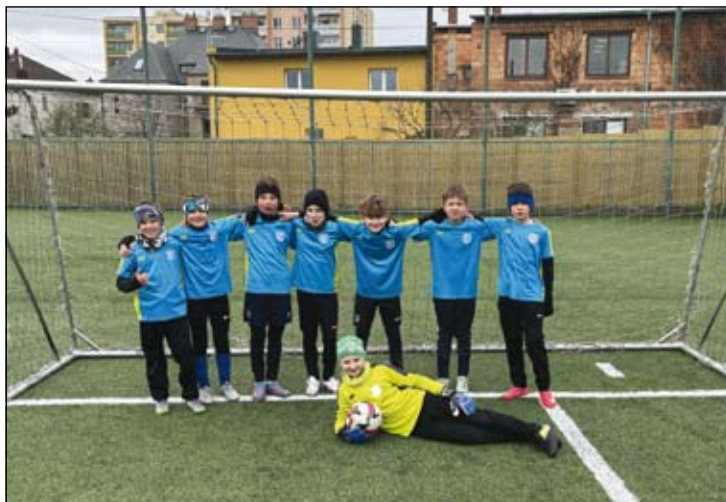
z Mc Donalds Cupu – kategorie B

Okrskové kolo této kategorie pro žáky 4.-5. tříd se konalo v Opavě Kylešovicích ve čtvrtek 9. dubna. Naši žáci porazili ZŠ Koberčice, ZŠ I. Hurníka i ZŠ Melč. Jediným přemožitelem našich fotbalistů se stala ZŠ Hradec nad Moravicí, která se stala i vítězem skupiny, a postoupila tak do okresního finále.