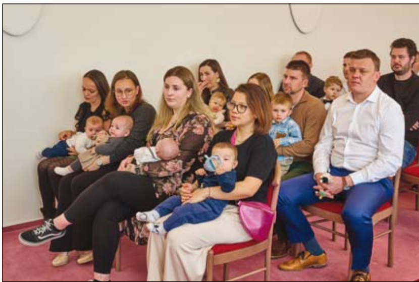
z vítání občánků