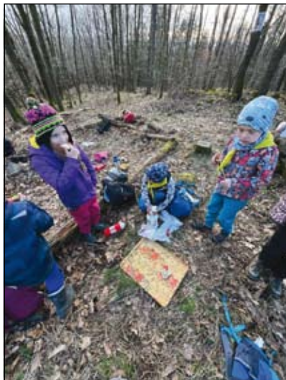
Hlad je nejlepší kuchař.