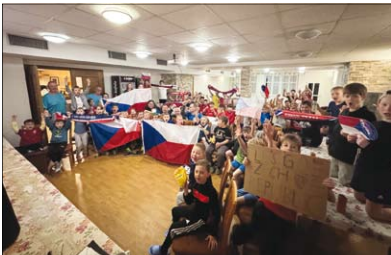
sledování kvalifikačního barážového utkání mezi Českou republikou a Irskem

Za celý trenérský tým patří velké poděkování všem dětem za jejich přístup, rodičům za podporu našich mladých nadějí a v neposlední řadě také všem sponzorům, kteří soustředění podpořili finančně, věcně či formou služeb a významně tak přispěli k jeho úspěšnému průběhu.