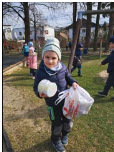
děti z MŠ Sovičky